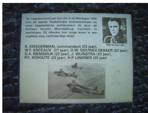
naamplaat op monument