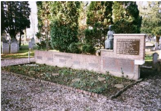
oorlogsmonument begraafplaats 'Rusthof' in Ridderkerk

Op de plaats van het tijdelijk graf op de begraafplaats 'Rusthof' in Ridderkerk is later een oorlogsmonument geplaatst met hierop de namen van de gesneuvelden in de Tweede Wereldoorlog in Ridderkerk. Ook de namen van de vijf bemanningsleden van de Fokker T-5 856 staan hierop vermeld.