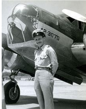
Bodo Sandberg in 1947

Volgens de site: www.grebbeberg.nl nemen Bodo Sandberg en Joop van den Breemer 'gewoon' weer deel aan luchtgevechten bij Woerden en bij de Grebbeberg.