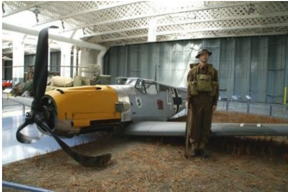
Hauptmann Karl Ebbighausen