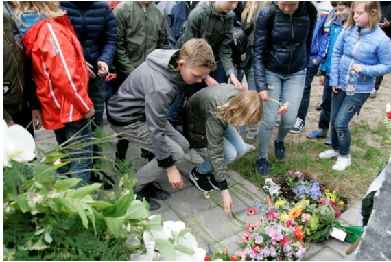
bloemengroet door de schoolkinderen