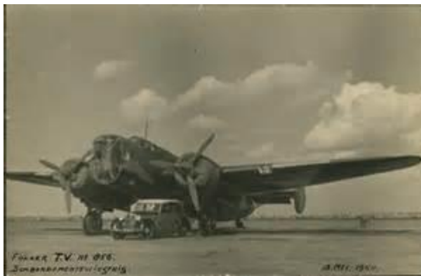
de Fokker T-5 856 op Schiphol op 13 mei 1940 vóór de start.

Bemanning T-5 en G-1's moeten na deze actie zo spoedig mogelijk tevens berichten of grote colonnes pantservoertuigen op of nabij de bruggen zijn waargenomen'.