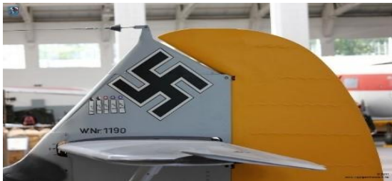
de staart van de Me-109 met de 'kill markings'