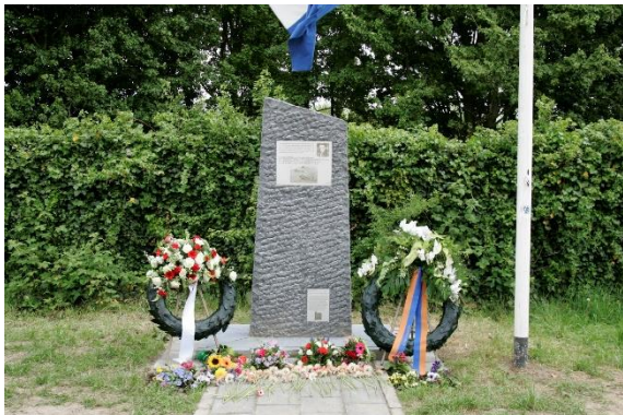
het monument ná de herdenking