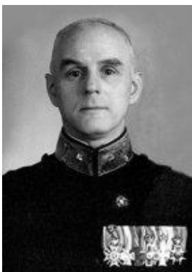
luitenant-generaal P.W. Best

'Onmiddellijk T-5 uitrusten met twee bommen van 300 kilogram met vertraging. Daartoe kan al het kostbare uit het vliegtuig worden verwijderd. Meest mogelijke spoed betrachten. Melden wanneer het toestel klaar kan zijn'.