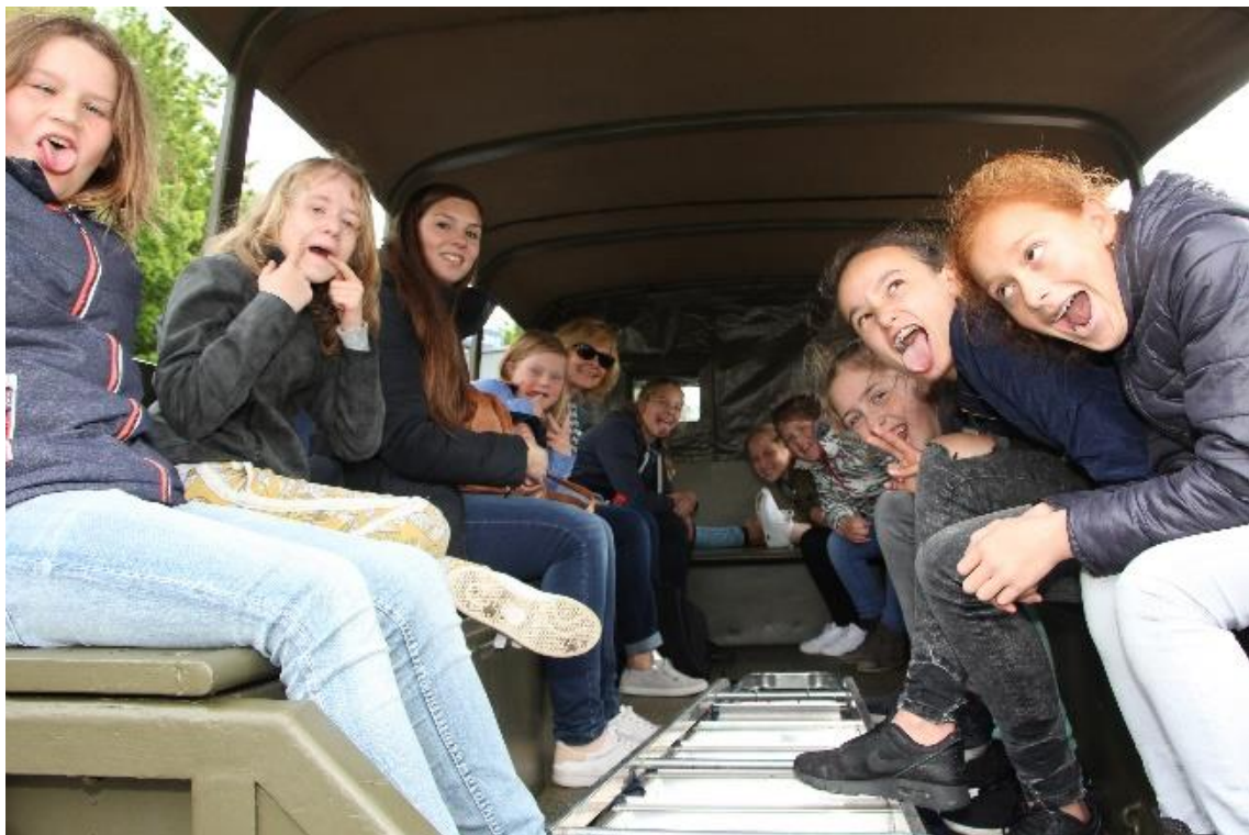
de schoolkinderen worden na de herdenking met het legervoertuig teruggebracht naar school.