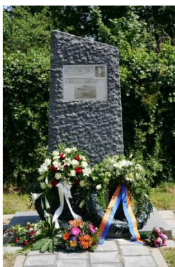
monument op de nieuwe plaats