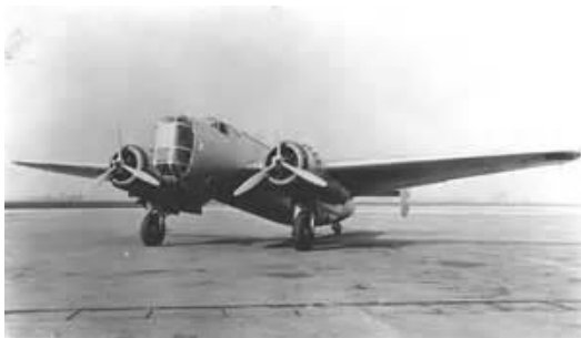
een Fokker T-5

Dit 'karwei' moet de laatst overgebleven Fokker T-5 856, vanaf thuishaven Schiphol uitvoeren.