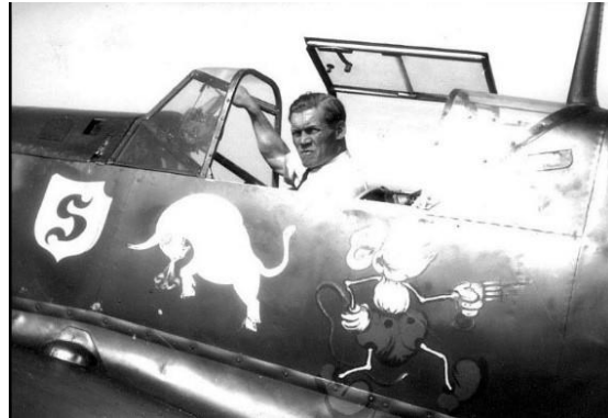
de Me-109 van Ebbighausen in het Militaire Luchtvaartmuseum Duxford bij Cambridge in Engeland