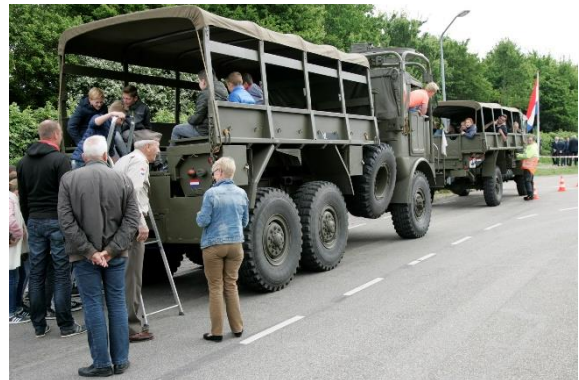
de schoolkinderen bij 2 van de 3 antieke legervoertuigen