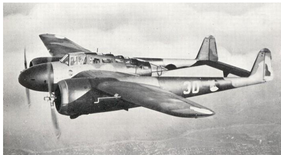
een Fokker G-1

De Fokker T-5 856 luchtkruiser zal voor deze aanval geëscorteerd worden door twee Fokker G-1 jagers.