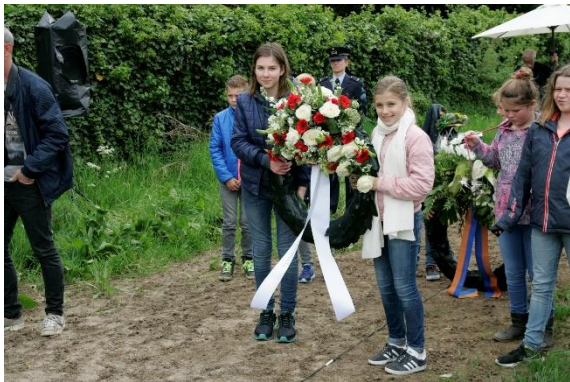
hulp van de schoolkinderen tijdens kranslegging en bloemengroet.